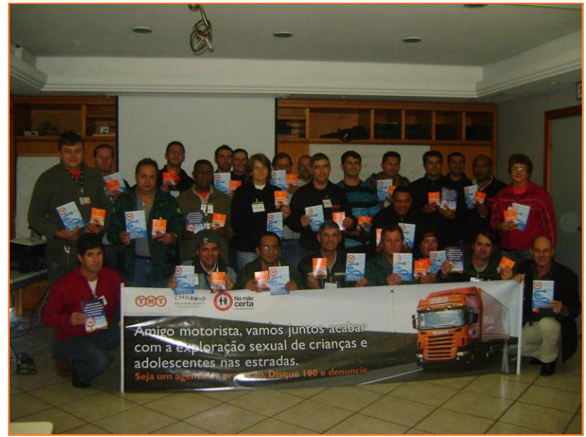
Foto de um dos grupos de motoristas ao final do treinamento