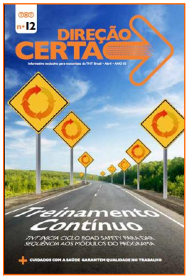
Edição especial da revista Direção Certa