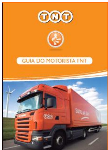
Cartilha do Motorista