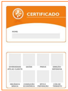
Card de acompanhamento dos treinamentos